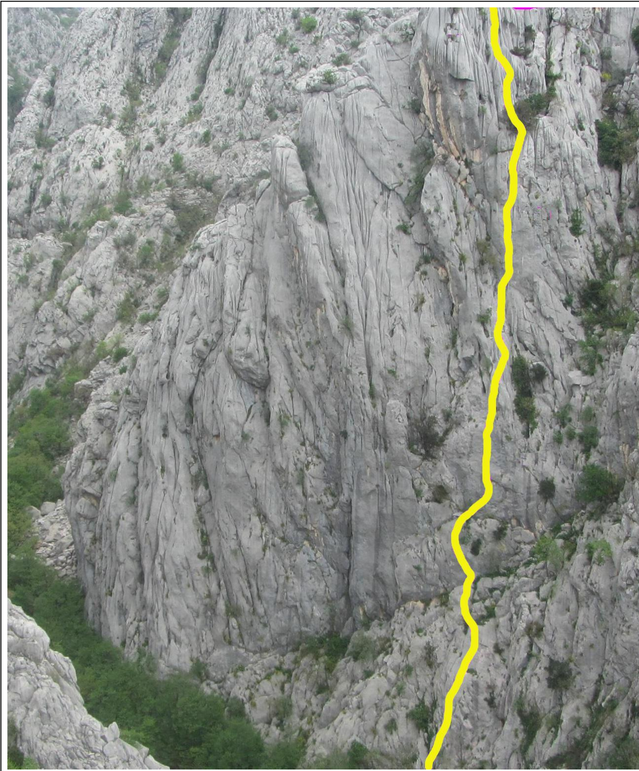
In GIALLO il tracciato della via.