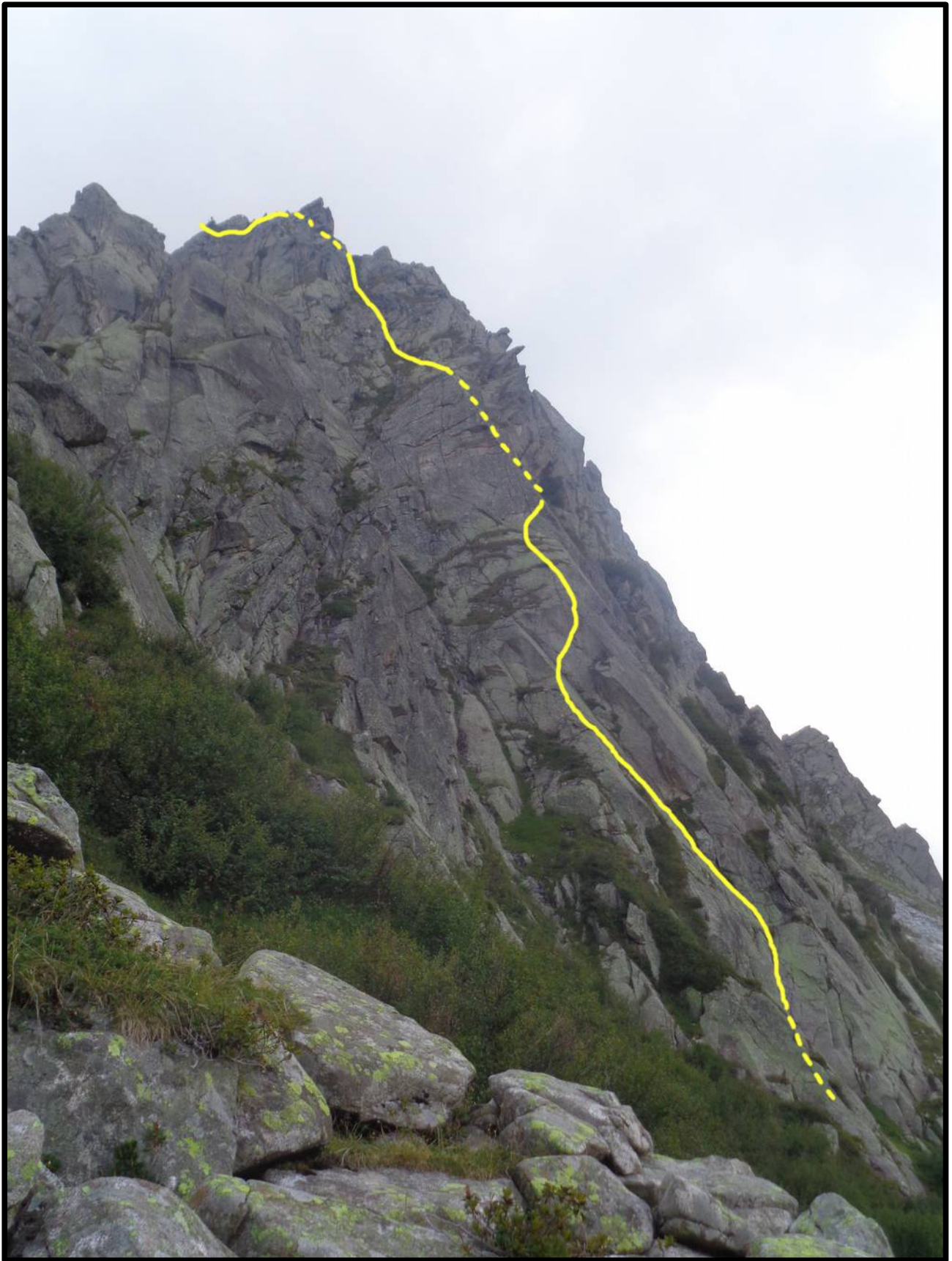
In GIALLO il tracciato della via.