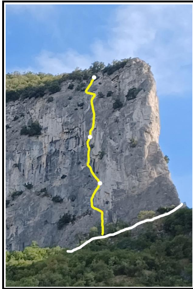
Il versante nord delle Rocche e il tracciato della via "I giorni delle cicale"