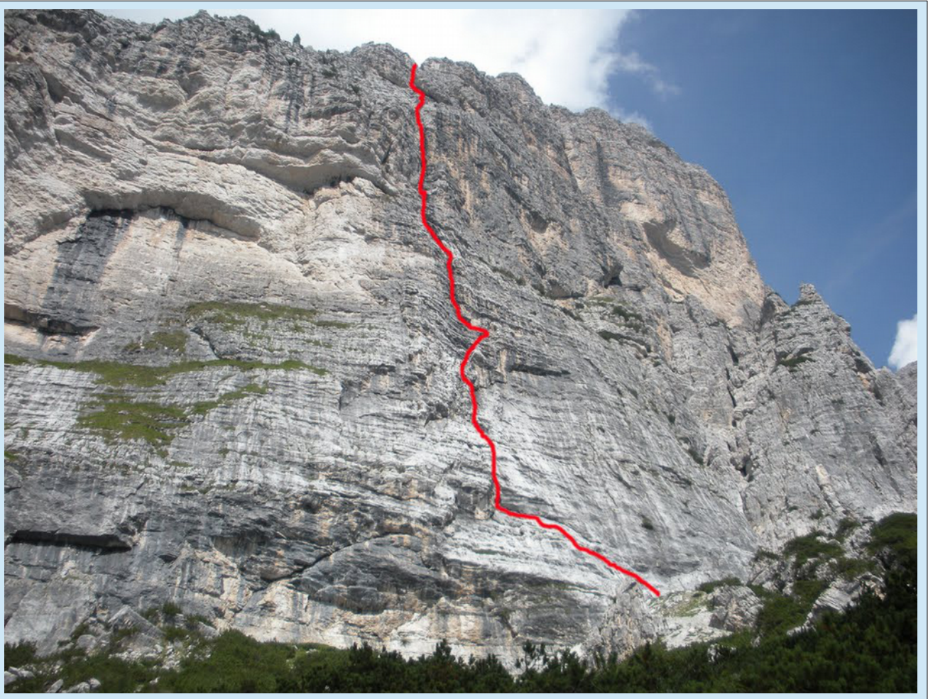
“Decima” - tracciato