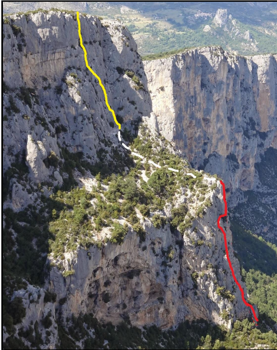
Il bel profilo del Dent d'Aire, con indicate le due vie proposte.

Accesso: da Nizza seguire la N85 per Castellane e poi la D952 fino a La Palud. Prima del paese svoltare a sinistra sulla D23, la panoramica Route des Cretes, che porta sul classico Belvedere de la Carelle e continuando al Belvedere del Dent d'Aire, dove si parcheggia.