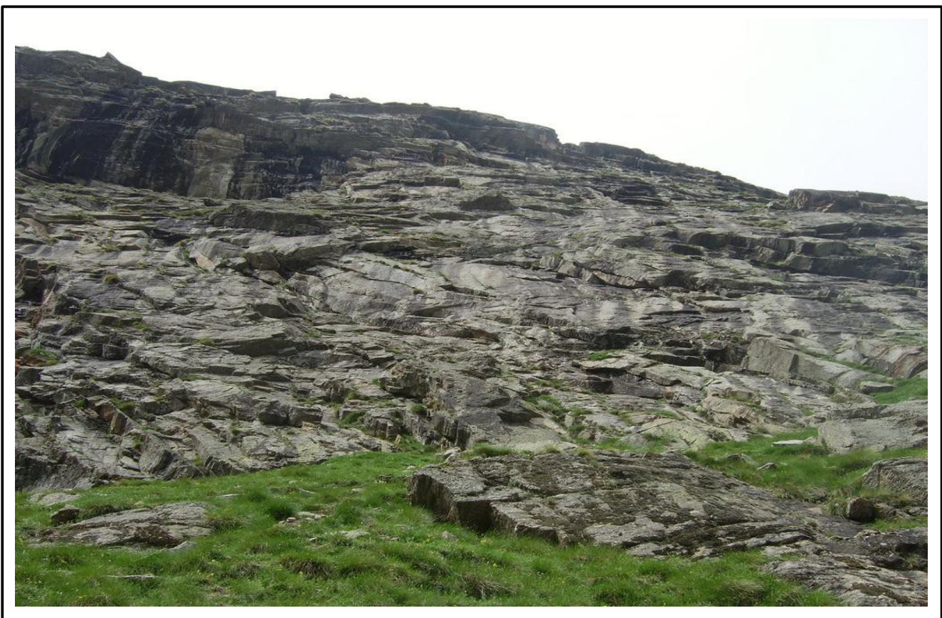
La parete vista poco prima dell'attacco.