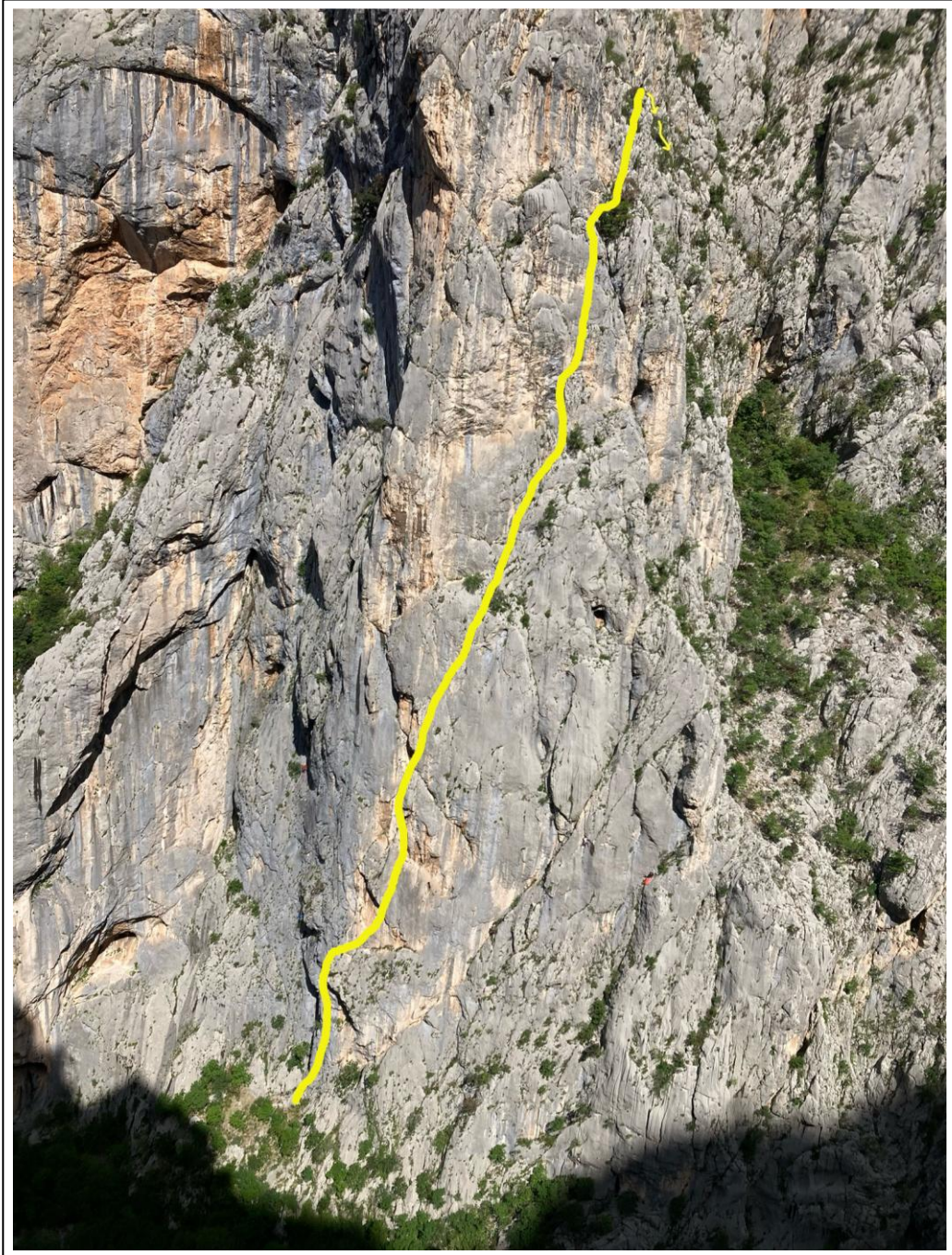
Il tracciato di "Diagonalka"