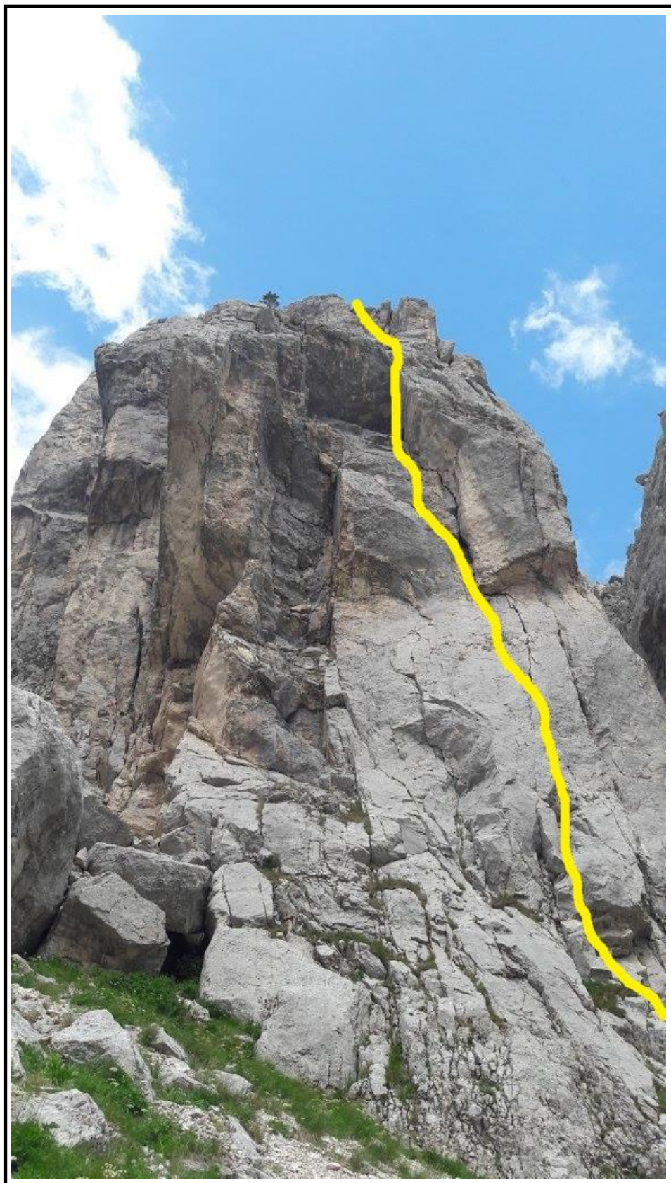
In giallo il tracciato della parte bassa (quella dove sono concentrate le maggiori difficoltà) della via