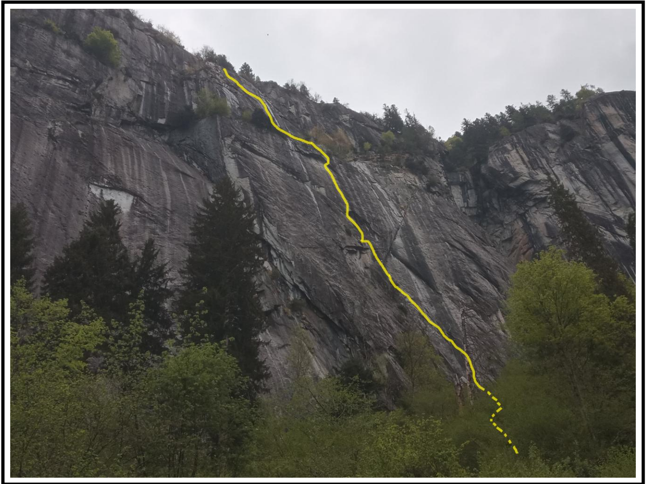
La bella parete dello Scoglio di Boazzo con il tracciato della via