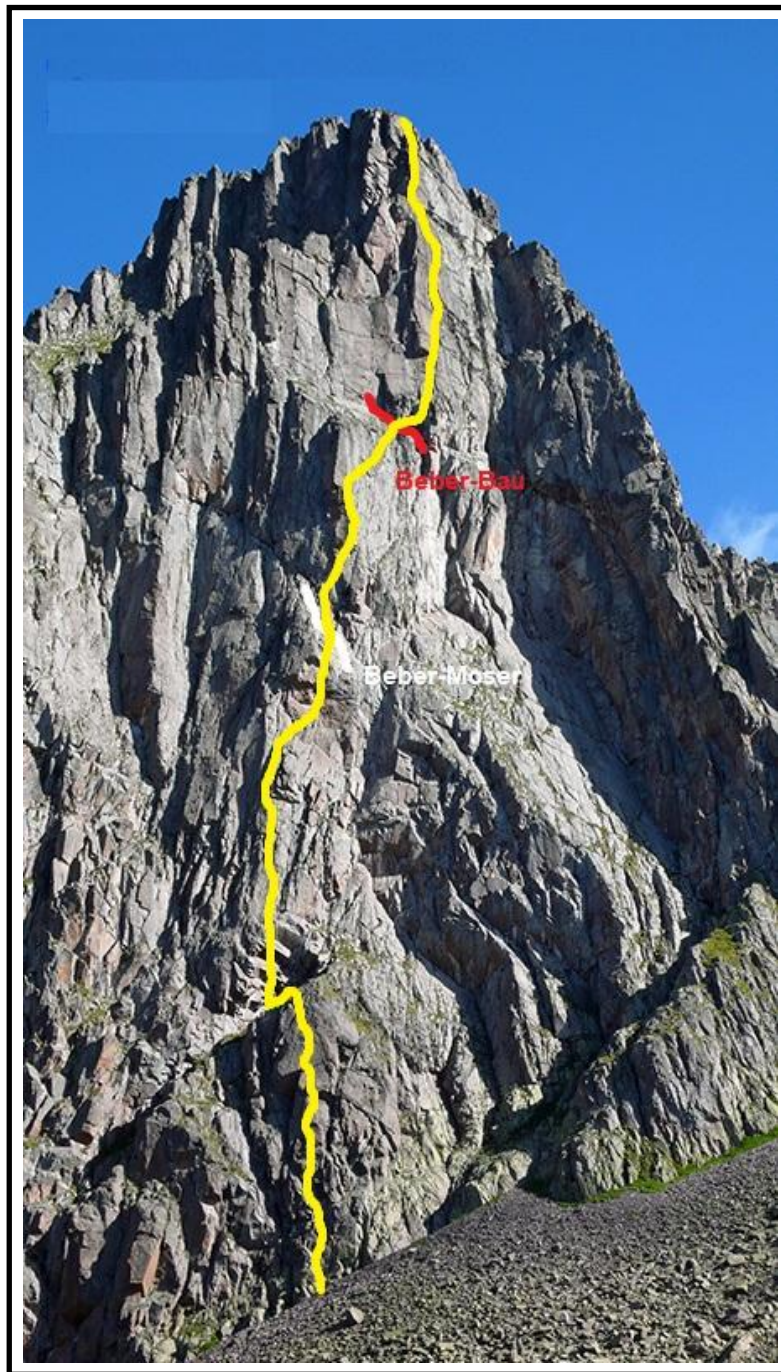
Cima Ceramana con in tracciato di "Follie belliche"