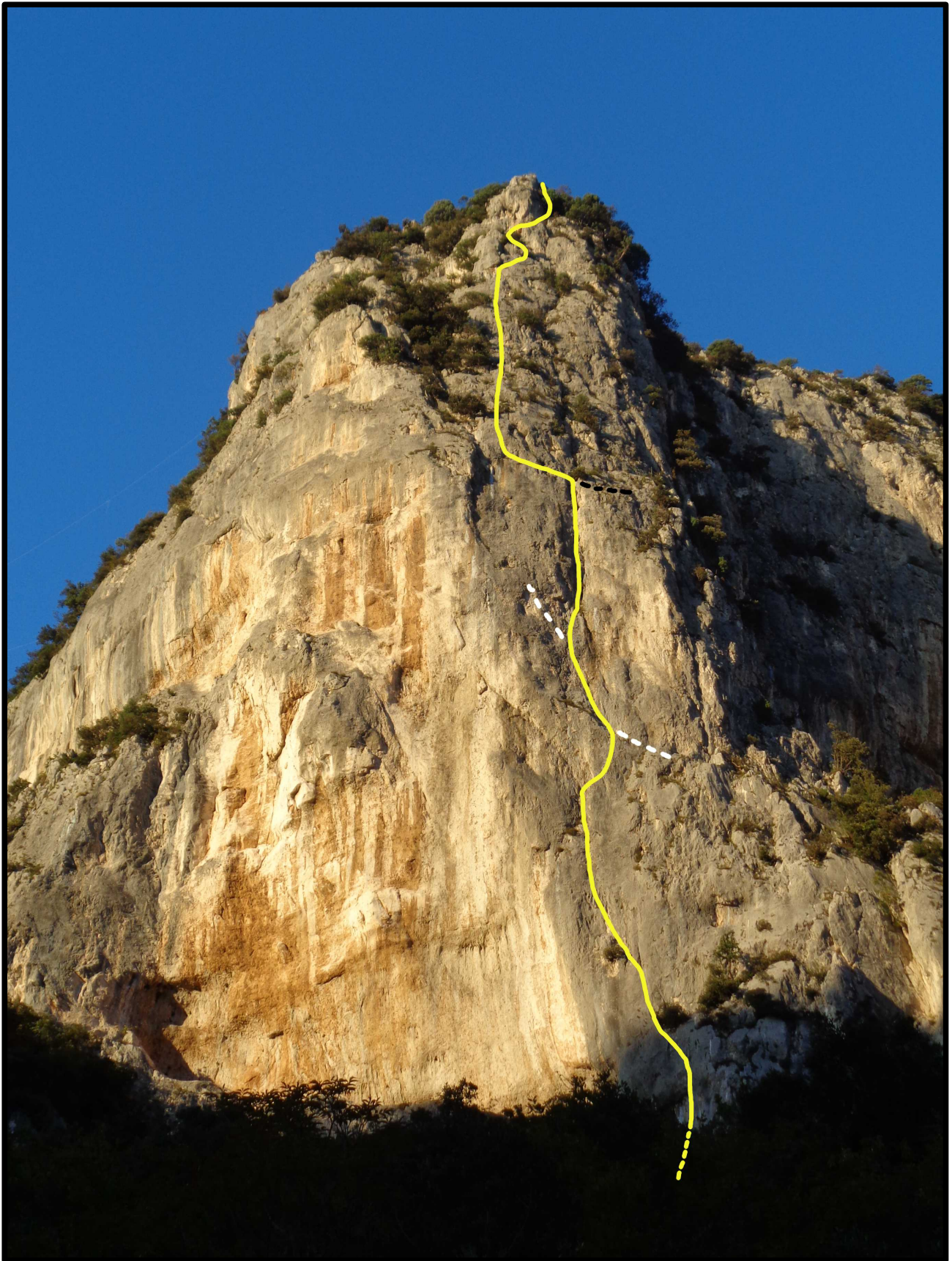
Tracciato della via