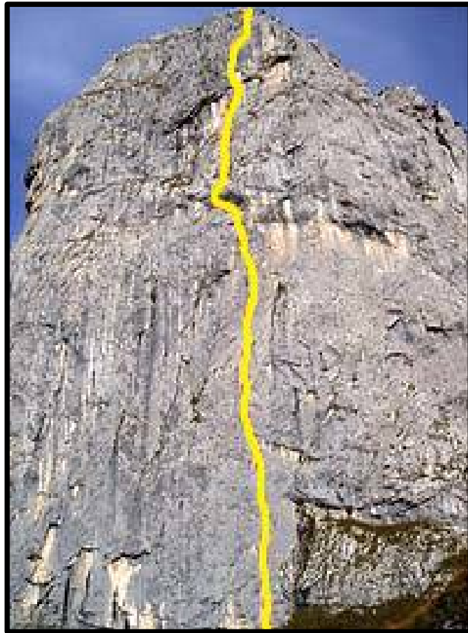
In GIALLO il tracciato di “Ibis”.