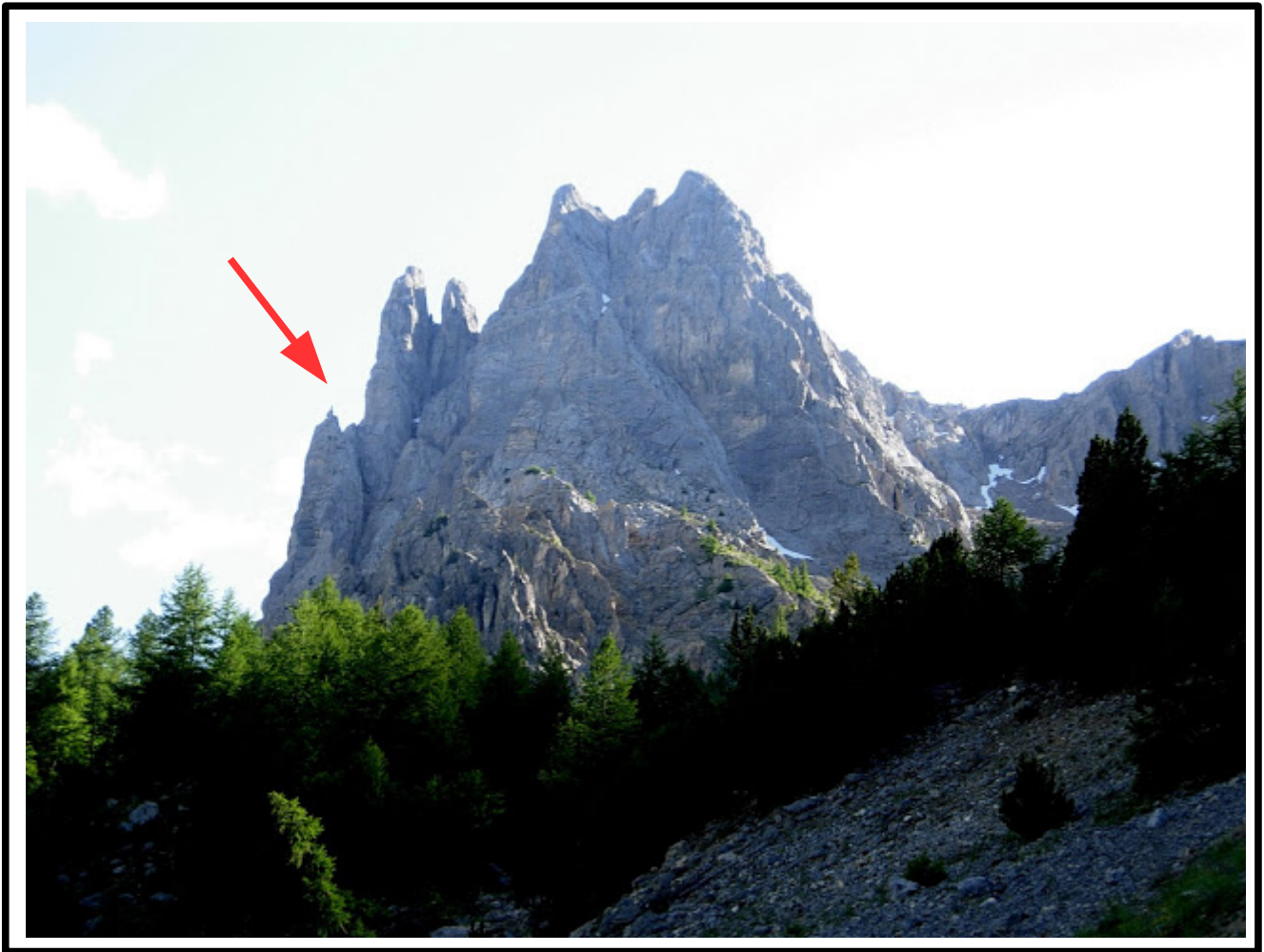
Il bel pilastro dove sale la via (FRECCIA ROSSA)