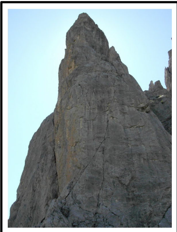
La parte alta del pilastro