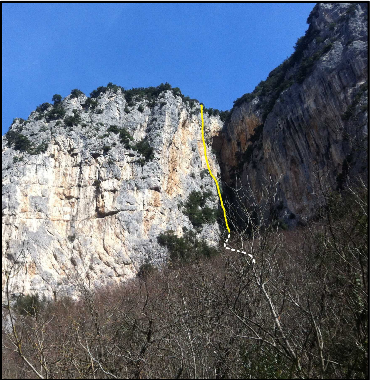
Tracciato di “Jamaica” (in giallo); in bianco il breve tratto attrezzato per arrivare all'attacco.