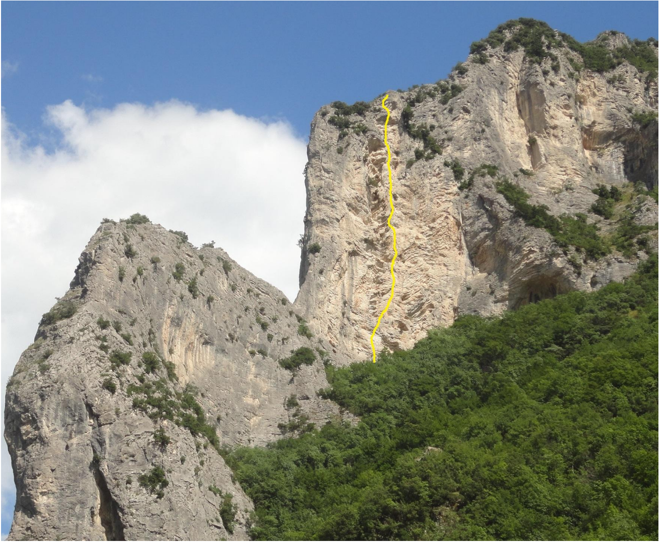
In GIALLO il tracciato di "Lancillotto".