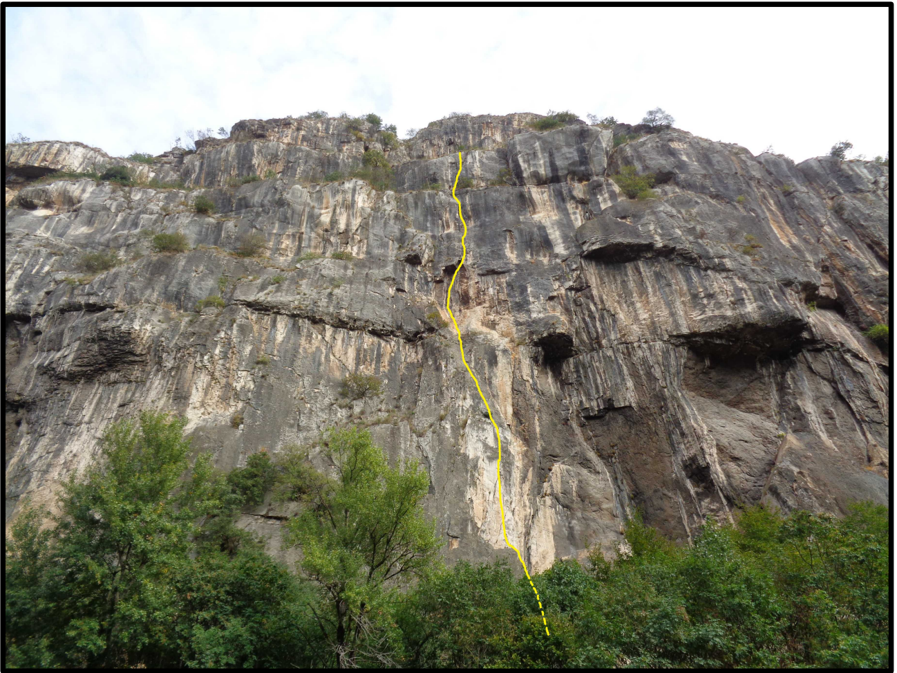
Una porzione della parete dell'Eldorado e il tracciato della via.