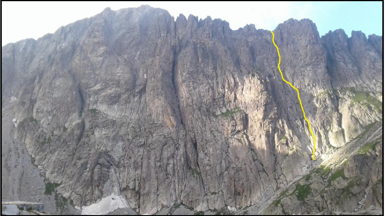
In GIALLO il tracciato della via "Lino-Egidio"