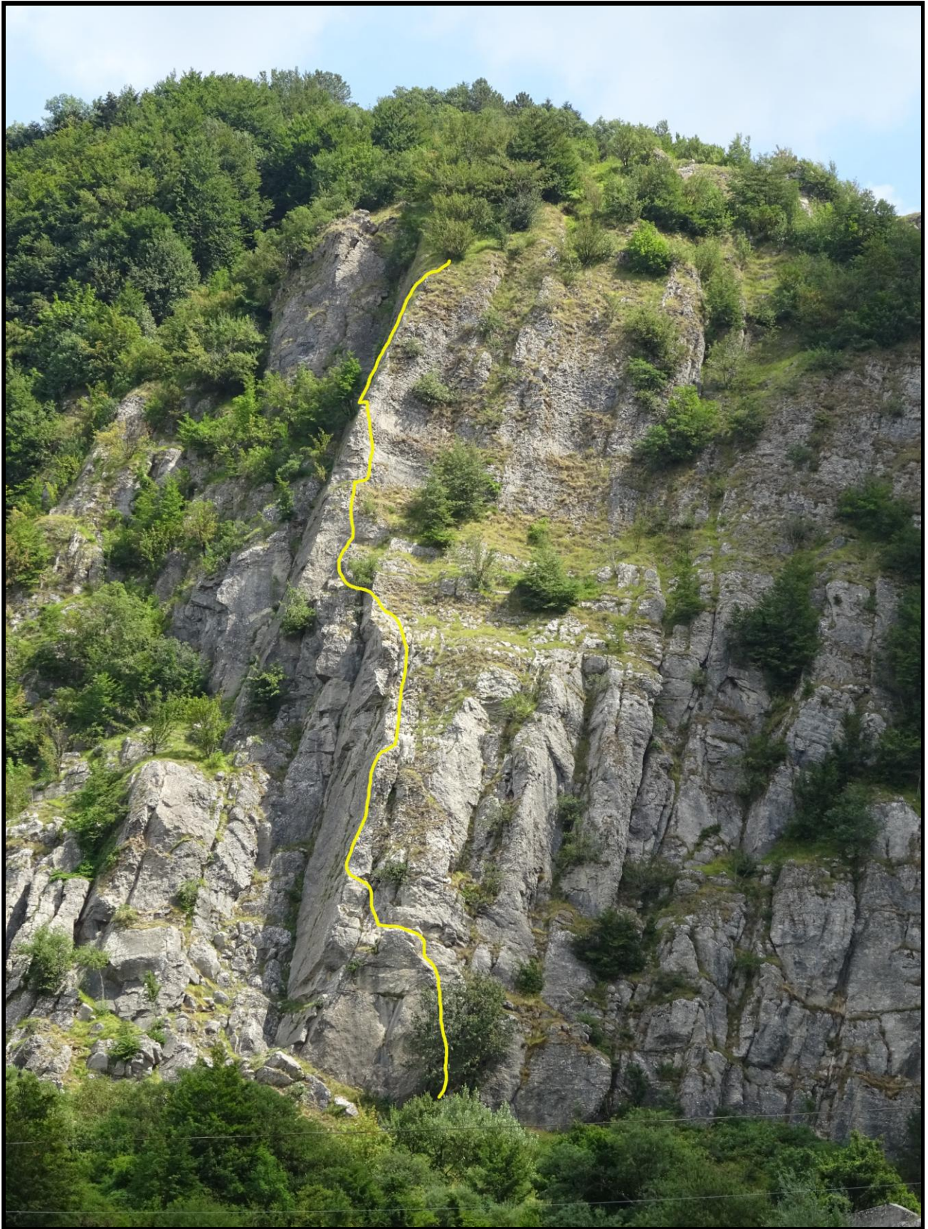
Il tracciato della via