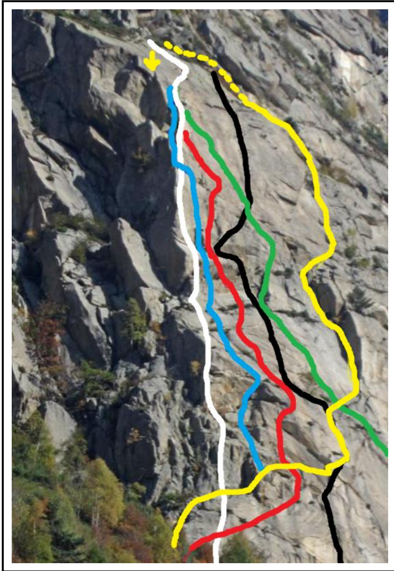
In giallo il tracciato di "Pesce d'Aprile"