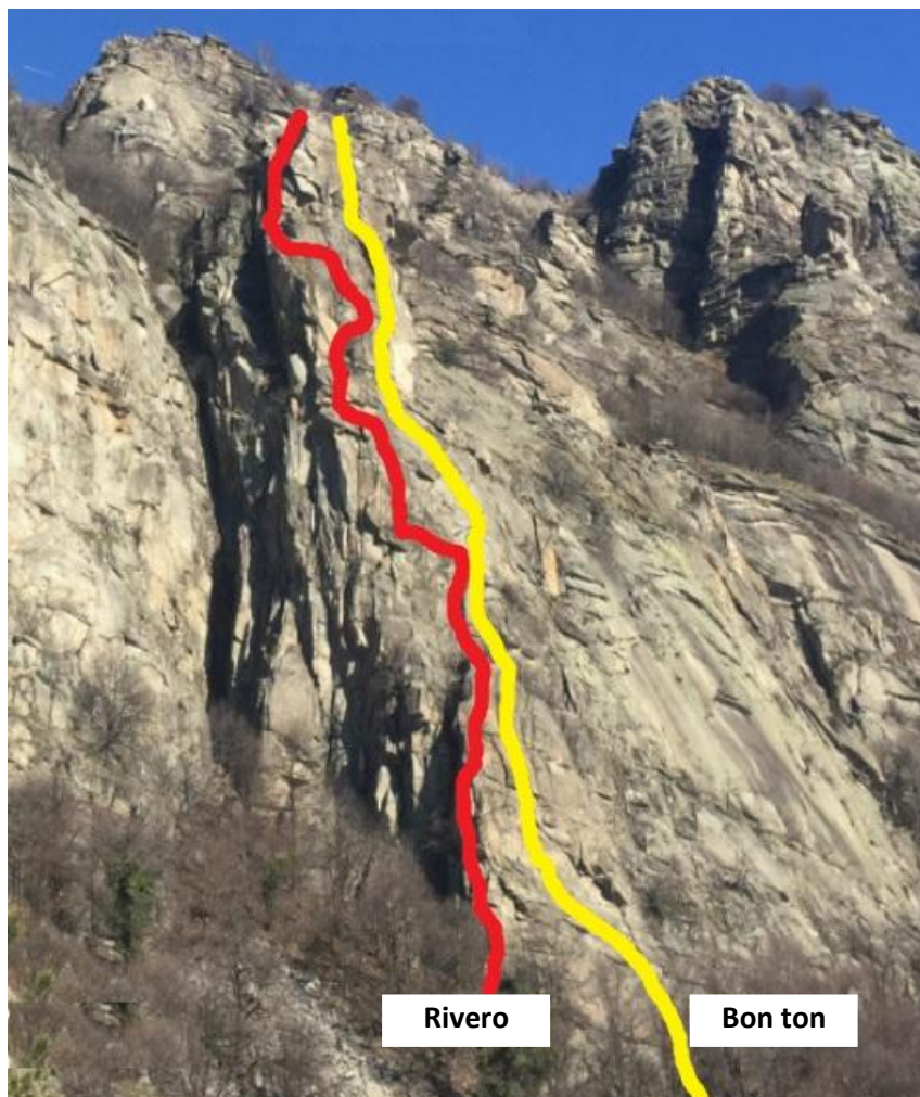
"Sperone Rivero" (colore ROSSO)

Seguire il bel sentiero panoramico e pianeggiante che in circa mezzora conduce al Rifugio Casa Canada. Lo sperone Rivero è il primo a destra rispetto al grande parete gialla che domina il rifugio (le Placche Gialle). L'attacco delle vie si raggiunge in meno di 10 minuti seguendo il sentiero che parte sulla destra del rifugio fino a una pietraia, dove lo si abbandona raggiungendo brevemente la base della parete.