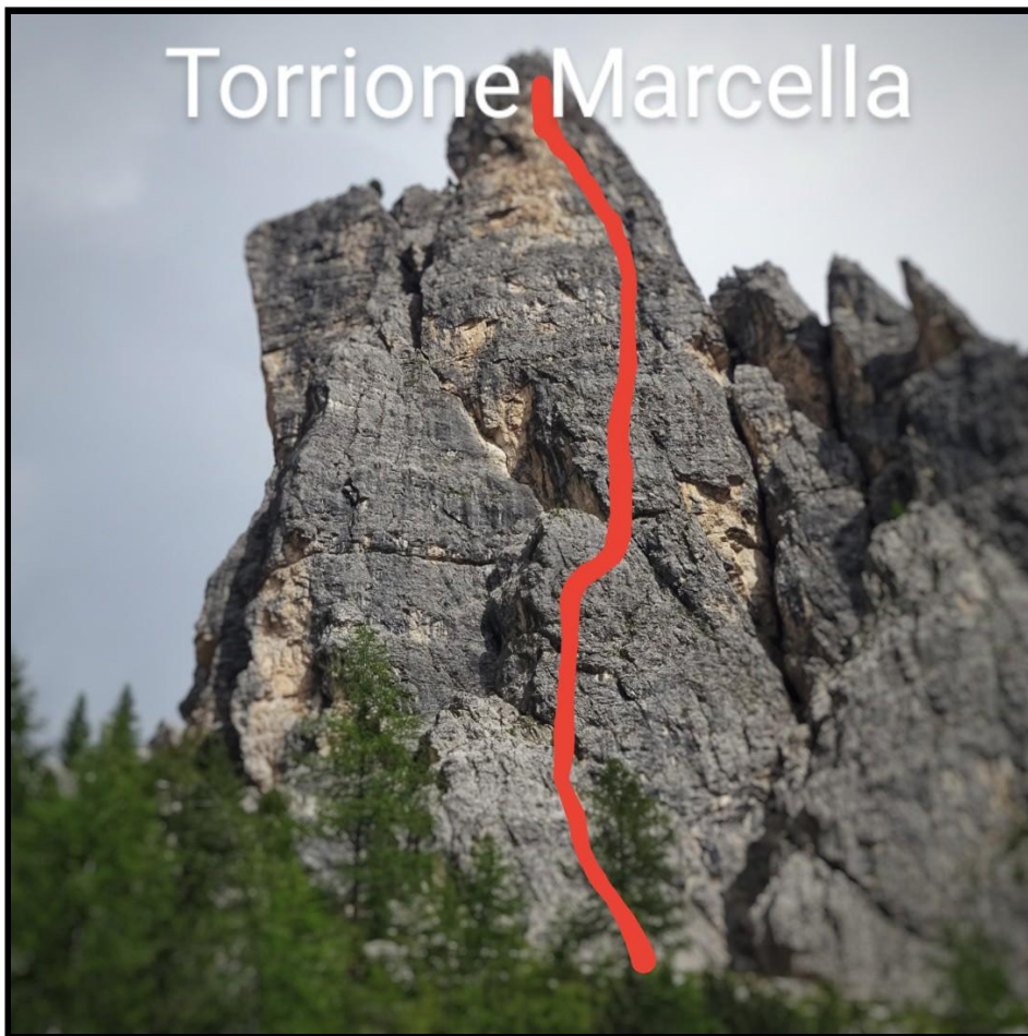
Il tracciato della via