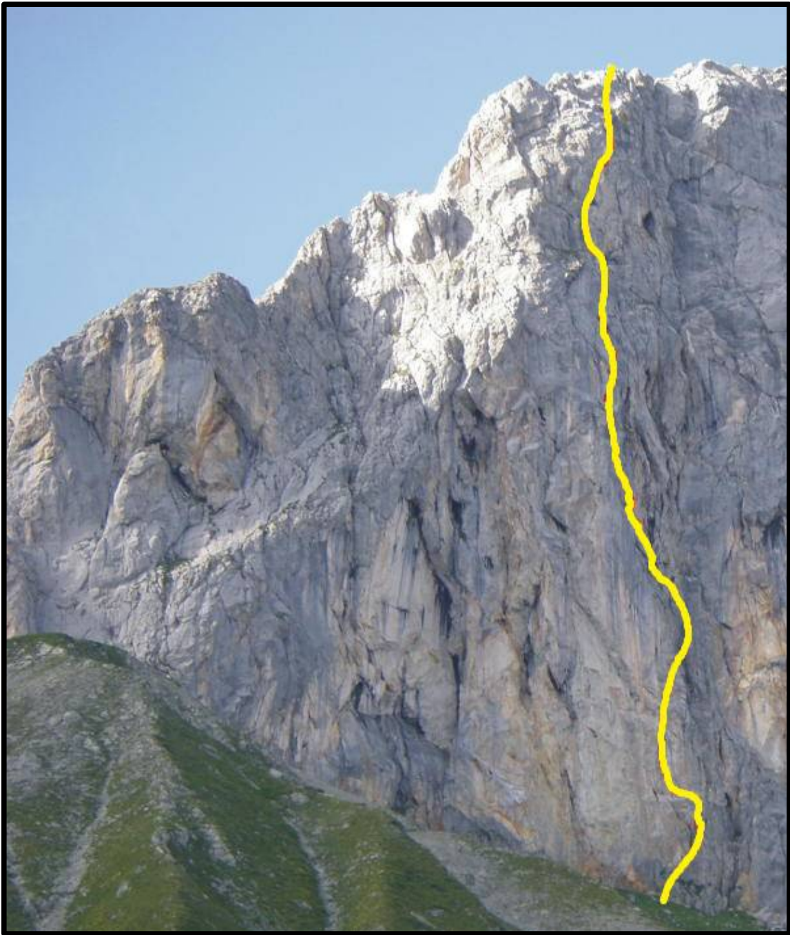
“Wolke 7” - tracciato